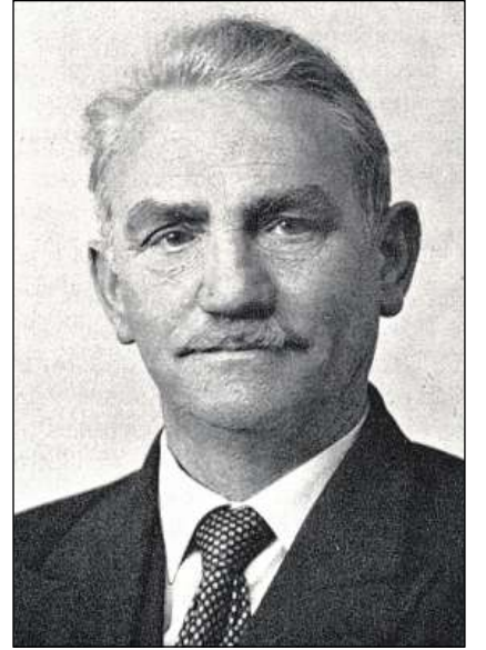
Gaudenz Canova (1887–1962), impurtant protagonist dal moviment socialdemocratic en il temp avant e durant la Segunda Guerra mundiala.

stanza a la Partida democratica en ils onns 1930. L'antifaschissem decedì ha fatg onur a la PS, el n'ha dentant betg gidà a schliar ses problems da quel temp. La crisa economica e la cooperaziun en l'uschenumna Moviment directiv (Richtlinienbewegung) han il cuntrari rinforzà la Partida democratica. Il 1935 è sortì Canova dal Cussegl naziun e la partida è crudada da 25 000 (1931) sin 16 000 (1939) vuschs. Ella ha pers ils employads da las Viafiers federalas svizzas, da la Viafier retica e dal stadi a la Partida democratica. Las partidas burgaisas ed il sistem da maiorz han minimisà la fracziun da la PS en il Cussegl grond; ella ha surpassà pir l'onn 2000 ils 10 mandats (13). A Cuira, nua che la PS predominava dapi decennis, è sa separada il 1945 ina fracziun comunista sco Partida da la lavur (da curta durada). Cün l'introducziun da l'AVS il 1947 ha cuntanschì la PS ina finamira sociopolitica