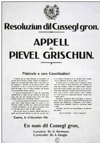
Resoluziun dal Cussegl grond a chaschun da la Chauma generala (1918).