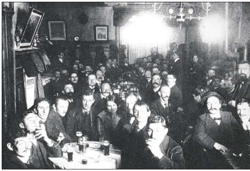
Sala dal restaurant Grütlibund a Cuira (enturn il 1913).